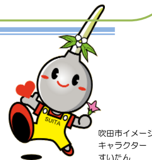
吹田市イメージキャラクター すいたん

行政経営部 企画財政室 総合計画グループ TEL : 06-6384-1743 / FAX : 06-6368-7343 E-mail : ks_sokei@city.suita.osaka.jp