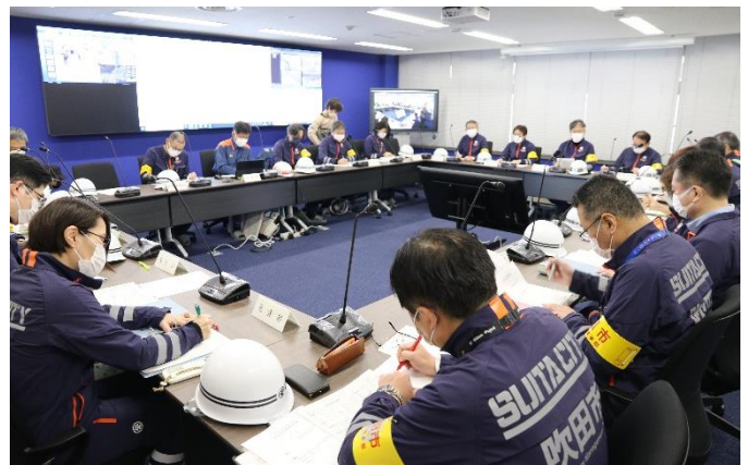
災害対策本部会議

以前は数時間かかっていた災害対策本部体制の構築が約30分で完了。速やかに情報収集を開始し、訓練開始から約60分後には、第1回の災害対策本部会議を開催することができました。また、自衛隊や警察等の参画を得て、円滑な受入や情報連携についても確認を行いました。