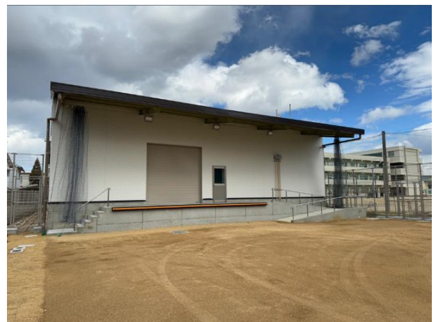
豊津・江坂・南吹田地域備蓄倉庫

豊津・江坂・南吹田地域備蓄倉庫を新設し、令和5年3月より供用を開始しました。これにより、市内6地域すべての備蓄倉庫の整備が完了しており、災害対応のフェーズに応じて備蓄物資や全国からの救援物資を避難所まで円滑に届けるための体制が市内全ての地域で整いました。