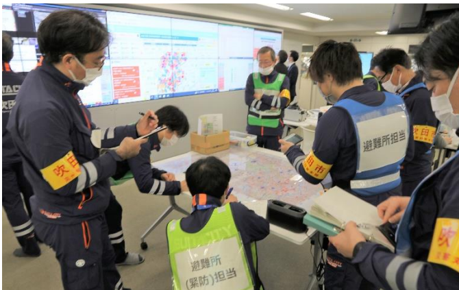
災害対応オペレーションルーム

吹田市では、一斉合同防災訓練における市独自訓練として、災害発生直後における初動体制早期確立・状況認識統一化訓練を実施しました。この訓練は、令和5年4月1日の本格稼働を控えていた危機管理センターの機能をフル活用し、初動対応体制の早期構築や、本部運営・受援体制の運用検証、新たに導入した災害対応オペレーションシステムによる災害対応の効果検証を目的として行いました。