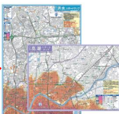
新ハザードマップ