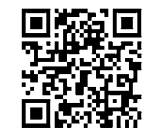
体育協会のホームページ

体育協会 各競技スポーツ団体で組織しています。「体育協会へ」となっている大会などは、郵送かファックス(〒564・0036寿町1・1・1寿ビル3階☎6381・9011☎6381・9022)で申し込んでください。土・日曜日、祝・休日は休み。