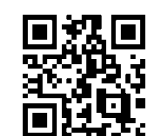
同連盟ホームページ

後夏期子ども水泳教室 定員など詳しくは吹田市水泳連盟ホームページを確認してください。☎☎前期☎7月21日(休)～29日(金)。小学生、4歳児。◇後期☎8月1日(休)～9日(火)。小学生、5歳児。いずれも午前8時50分～9時45分。土・日曜日は除く。☎所 片山市民プール。☎6000円。☎7月1日(休)～7日(休)に郵便はがきと筆記用具を持って直接か、◆と性別を往復はがきで吹田市水泳連盟(片山市民プール内☎6388・4501☎火・日曜日、祝日を除く午前9時～正午)へ。必着。小学生は学年、学校名、前期・後期の希望も記入。 自すつきりストレッチ ☎7月19日～9月27日の火曜日午後2時30分～3時30分。☎所 総合運動場。☎中学生以下は除く。☎先着25人。☎3500円。☎7月4日(月)から直接か電話で同運動場へ。 自スポーツ塾 マット・鉄棒 ☎7月30日(出)午前10時～11時30分。☎所 依市市民体育館。☎小学1～3年生。☎先着25人。☎800円。☎7月1日(休)から直接か電話で同館へ。 雨市民ゴルフ大会 男女別、年齢別の計7部。☎8月22日(月)。☎所有馬ロイヤルゴルフクラブ(兵庫県)。☎先着160人。☎1万8500円。ジュニア5000円。☎7月1日(金)～31日(日)に所定の用紙を新御堂ゴルフセンター(江坂町4☎6385・4560☎6385・9866)へ。 雨市長旗争奪秋季野球大会 ☎9月4日(日)から日曜日、祝日。☎所中の島スポーツグラウンド。☎市内在住者や市内の同一事業所で構成したチーム。☎1万円。☎8月2日(火)までに費用を振り込み、所定の用紙を吹田市野球連盟(☎6383・6892☎火・土曜日午後1時～5時)へ。 雨健康づくり秋季壮年野球大会 ☎9月4日(日)から日曜日、祝日。☎所中の島スポーツグラウンド。☎40歳以上の市内在住者や市内の同一事業所で構成したチーム。☎1万円。☎8月2日(火)までに費用を振り込み、所定の用紙を吹田市野球連盟(☎6383・6892☎火・土曜日午後1時～5時)へ。 雨トリアスロン・アスロン大会 ☎9月4日(日)。☎所 北千里市民プールなど。☎対☎◇トリアス