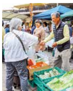
新鮮な地元野菜が並びます

時7月。◇8日(金)志望動機で差をつける履歴書の書き方。10人。◇13日(水)初心者向けパソコン講座。3人。◇21日(水)ビジネス