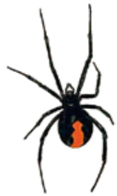
体長はオスが2.5～3mm、メスが10～14mm。体色は暗褐色か黒色。オスは背中赤い模様がありません。

市内でセアカゴケグモの生息が確認されています。排水溝などのふたの裏やコンクリートブロックの中、エアコン室外機と壁の間などに潜んでいます。刺激をしなければ人を襲うことはありませんが、誤って触れた時に人をおかむことがあります。草刈りなど野外で作業するときは軍手を着用するなど注意しましょう。発見したら家庭用殺虫剤で駆除し、卵が周囲に飛散しないように袋に入れて踏みつぶしてください。かまれたら患部を水洗いし、駆除したクモを持って、医療機関で受診してください。☎環境政策室(☎6384・1361 FAX6368・9900)。