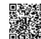
ひとり親世帯以外