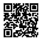
メール配信サービスの登録ページ