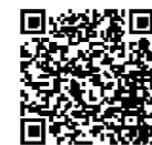
LINE配信サービスの登録ページ