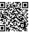
受診可能な医療機関はこちら(府ホームページ)