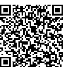
事業所で感染者が発生した場合の対応

高齢者・障がい者施設、学校・児童関連施設、入院病床を有する医療機関以外は、原則、各事業所で濃厚接触者の特定をしてください。事業所の対応方法などは市ホームページを確認してください。