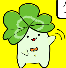
ハローワーク淀川イメージキャラクター ハローパー