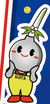
吹田市イメージキャラクター すいたん