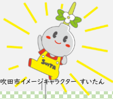
吹田市イメージキャラクター すいたん

藤原社会保険労務士事務所 特定社会保険労務士 大阪府社会保険労務士会理事、大阪南支部顧問 公益財団法人介護労働安定センター 雇用管理コンサルタント