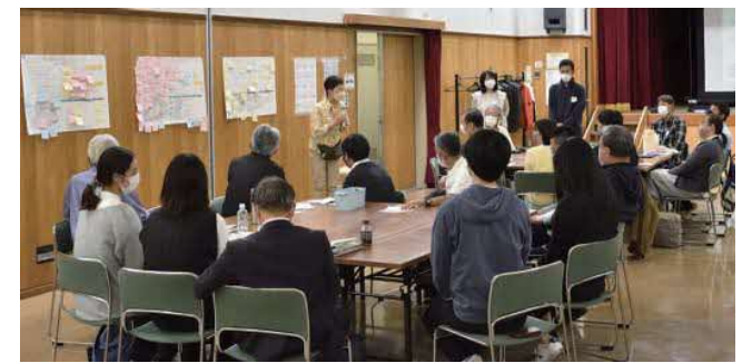
参加者：15名 会場：吹田市立内本町コミュニティセンター

10月8日に中の島公園で行った実験の結果を、ポイントラリーで確認した内容や実験後にご協力頂いたアンケート結果を基に、みなさんと共有しました。更にグループワークでは、ねらい通り実現できたことや課題・可能性について確認し、公園のイメージをふくらませた上で、これからの公園整備に向けてのタイムスケジュールを基に、実現に向けてのステップについて話し合いました。