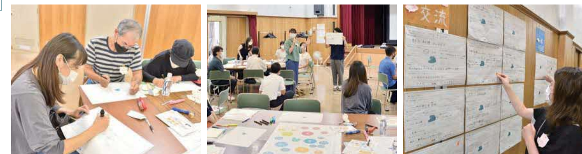
参加者：25名 (+ お子さん7名) 会場：吹田市立内本町コミュニティセンター

それらのアイデアの中から、みなさんが特にやってみたい！と思ったアイデアについて、「イイね！」シールで投票して頂きました！