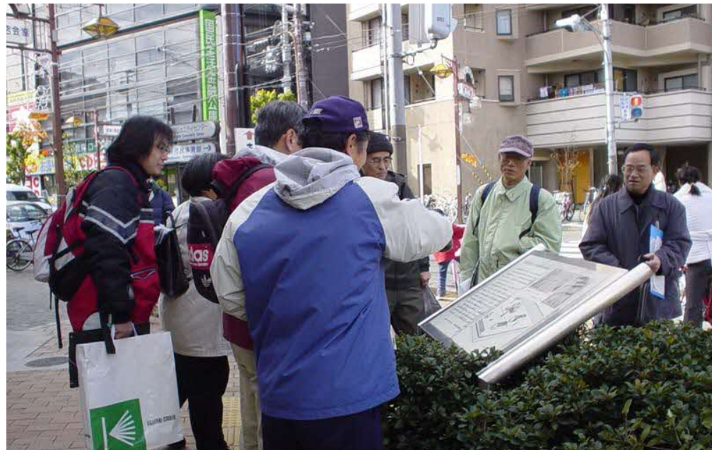
2003/11～ ぶらっと吹田 基本計画ワークショップ