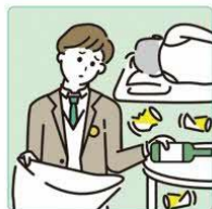
アルコール・薬物・ギャンブル問題を抱える家族に対応している。