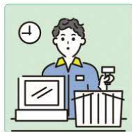
家計を支えるために労働をして、障害や病気のある家族を助けている。