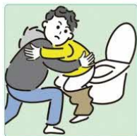
障害や病気のある家族の入浴やトイレの介助をしている。