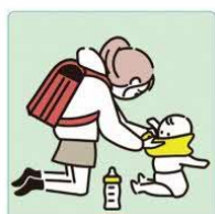
家族に代わり、幼いぎょうだいの世話をしている。