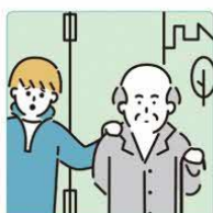
目を離せない家族の見守りや声かけなどの気づかいをしている。