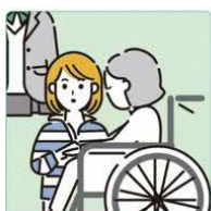
障害や病気のあるぎょうだいの世話や見守りをしている。