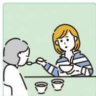
障害や病気のある家族の身の回りの世話をしている。