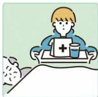
がん・難病・精神疾患など慢性的な病気の家族の看病をしている。