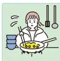
障害や病気のある家族に代わり、買い物・料理・掃除・洗濯などの家事をしている。

※「過度に」とは、「こどもにおいてはこどもとしての健やかな成長・発達に必要な時間（遊び・勉強等）を、若者においては自立に向けた移行期として必要な時間（勉強・就職準備等）を奪われたり、ケアに伴い身体的・精神的負荷がかかったりすることによって、負担が重い状態になっている場合」を指します。（こども家庭庁通知引用）