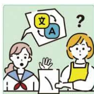
日本語が第一言語でない家族や障害のある家族のために通訳をしている。