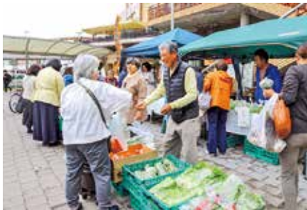
新鮮な地元野菜が並びます

地産地消の取り組みとして、新 鮮な旬の地元農産物を販売しま す。たけのこの販売も。 時所 ◇江 坂朝市◇4月10日(日)午前9時30分 ～11時。豊津公園。◇吹田元気農 家とハピスマ朝市◇4月20日(水)午 前10時30分～正午。さんくす夢広 場。いずれも売り切れしだい終了。 閘地域経済振興室農業担当 (TEL6384・1373 FAX636 8・9909)。