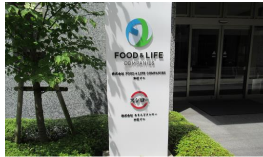
植栽地に配置された広告物の事例