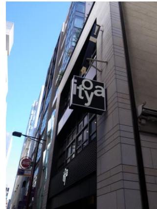
歩行者に向けて低層部で効果的に表示した事例