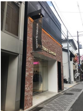
建築物デザインと一体感を持たせたバナーによる突出広告物の事例