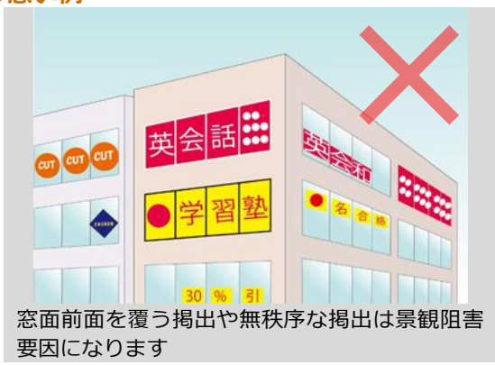
窓前面を覆う掲出や無秩序な掲出は景観阻害要因になります