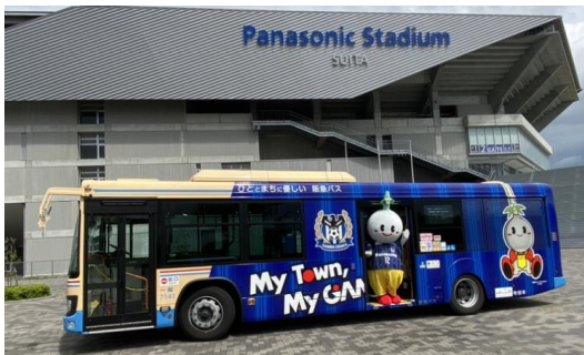
コーポレートカラーを使用したバスラッピングの事例