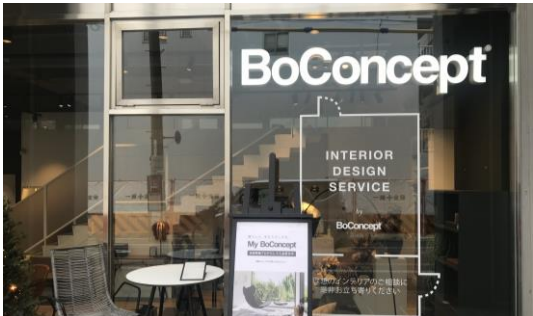
最小限の広告物で効果的に魅せている事例