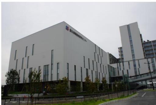
屋上ではなく、建築物の外観意匠等に配慮し壁面に設けられた事例