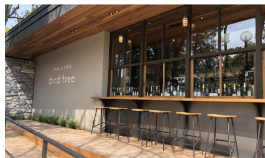
外観デザインに合わせてシンプルなサインを配置した事例