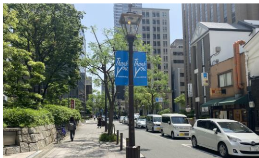
必要最小限の大きさに通りの魅力を創出している事例