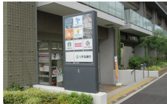
複数のテナントを集合化した事例