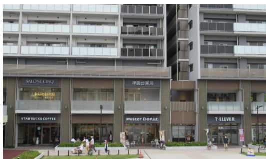
建築物デザインと一体感を持たせた事例