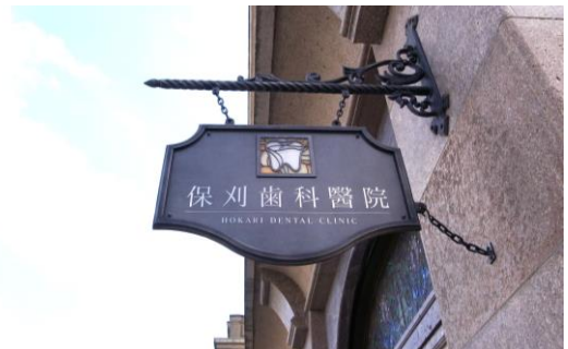
地色を低彩度とし、建物と調和した色を用いた事例