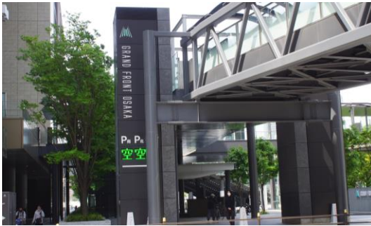
周囲の建築物や工作物の色彩やデザインと調和するように配置された事例