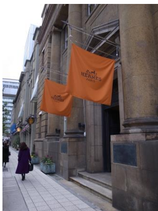
通りに面した壁面に広告旗を設置し、通りの賑わいを演出している事例