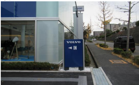
建築物にデザインを調和させて高さを低く抑えた駐車場案内サインの事例