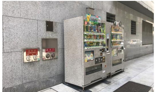
自動販売機本体の色彩等を背後の外壁材と同調させて目立たなくさせた事例