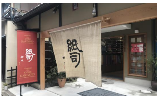
歴史的な外観に合わせて広告幕を配置している事例