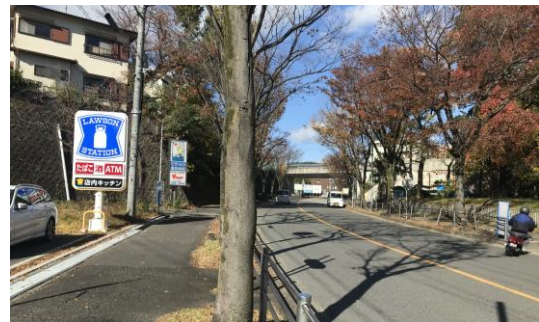
見通しを妨げないように高さを低く抑えた広告物の事例