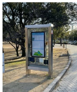
歩行者からの見え方に配慮されたデジタルサイネージ事例