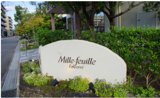
地色に周辺のまちなみに調和した色を用いた広告物の事例