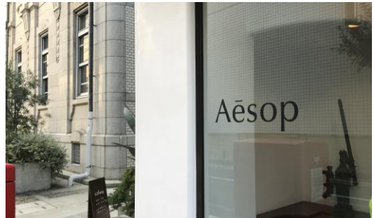
切り文字で窓に貼り込んでいる事例