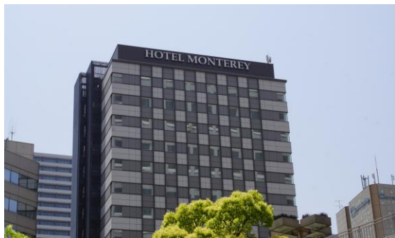
屋上付近の外壁色を活かし箱文字サインを配置した屋上広告物の事例