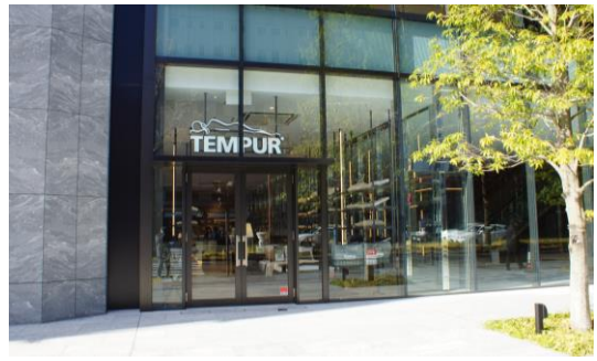
窓面から一定の距離をとり、建築物の外観に配慮した事例