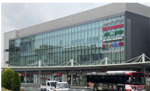
箱文字デザインにコーポレートカラーを使用し、大きさや幅を揃えて配置した事例