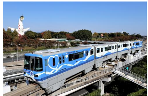
沿線の景観に配慮されたラッピング列車の事例