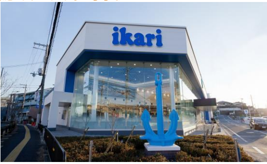
スーパーは窓面に広告物を設置しがちですが、設置せずにガラスの透過性を活かし、建物内を効果的に魅せている事例