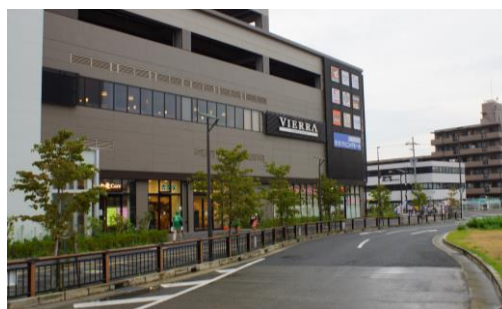
外壁デザインに合わせて複数の広告物を集合配置した事例