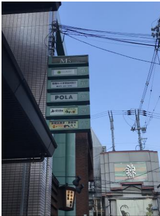
1建物で整理、集合化させた事例