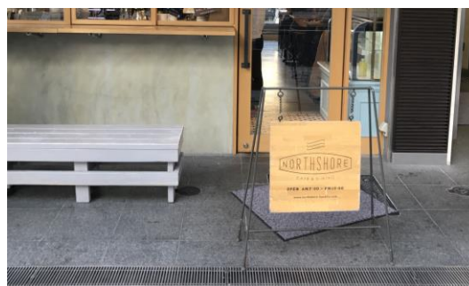
シンプルなデザインの立看板事例