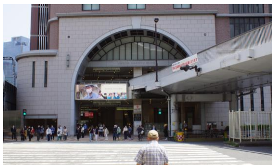
商業地に配置されたデジタルサイネージ事例