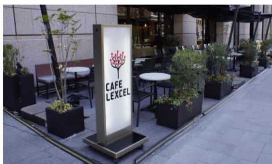
敷地内に計画的に配置された事例