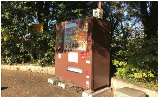
背景の緑と調和する落ち着いた色彩を用いた事例