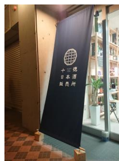
店の雰囲気を感じさせる広告幕を配置している事例