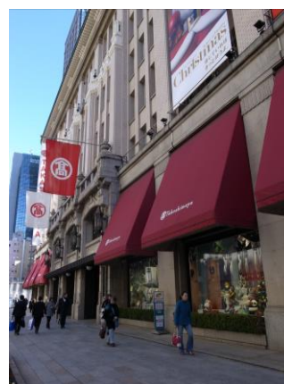
コーポレートカラーを使い、通りの賑わいを演出している事例