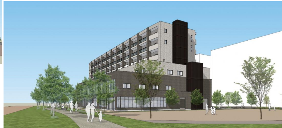
南側歩道岸辺駅方向より全景