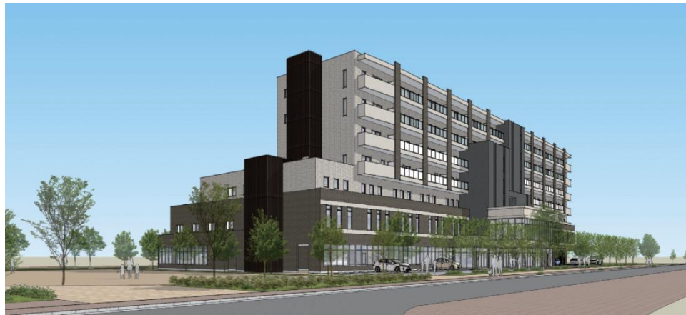
北側道路岸辺駅方向より全景