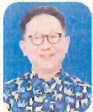
森 たけし (ytvアナウンサー)