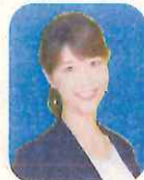
虎谷 温子 (ytvアナウンサー)