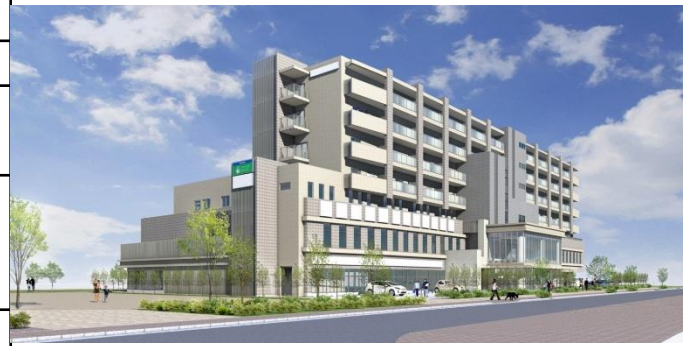
北側道路岸辺駅方向より全景