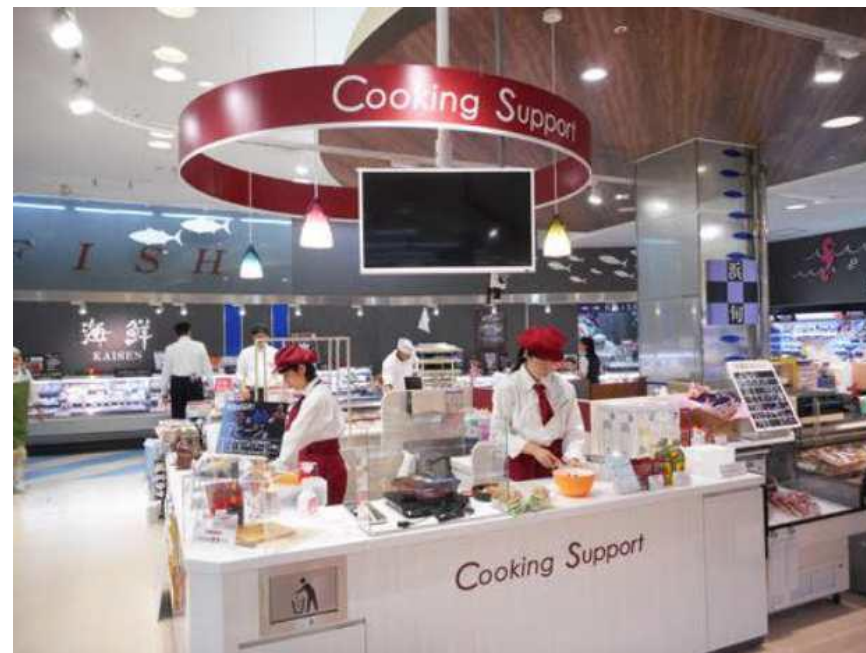
クッキングサポートのイメージ