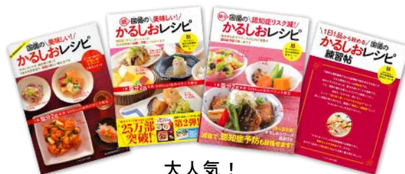
大人気！ 「国循の かるしおレシピ」シリーズ

○美味しさと栄養バランスを兼ね備えつつ食塩を控えた食品に対して、国立循環器病研究センターが認定マークを付与した「かるしお認定商品」も多数取り揃えます。