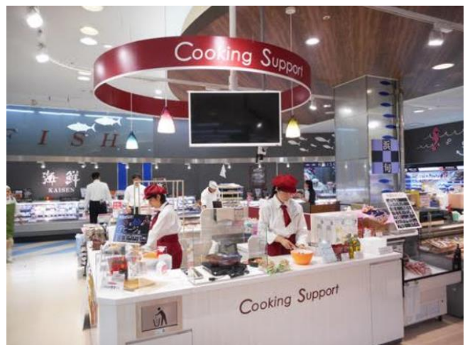
「クッキングサポート」イメージ