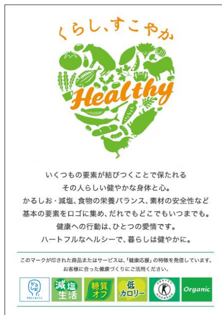
「店頭ポスター」イメージ

「いくつもの要素が結びつくことで保たれるその人らしい健やかな身体と心。かるしお・減塩、食物の栄養バランス、素材の安全性など基本の要素をロゴに集め、だれでもどこでもいつまでも。健康への行動は、ひとつの愛情です。ハートフルなヘルシーで、暮らしは健やかに。」