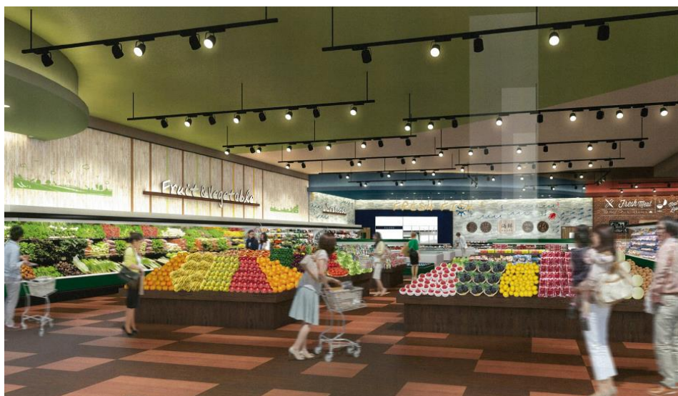
青果売場イメージ

フレンドマート健都店は、毎日の生活のお役に立つ店舗として、また、心と体が健康で美しく豊かな日常を過ごせるよう、お客様のライフスタイルに寄り添う店舗として、さらに、地域の健康を担うインフラとして愛される店舗を目指してまいります。