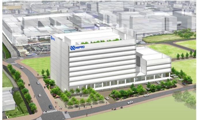
(鳥瞰パースイメージ)