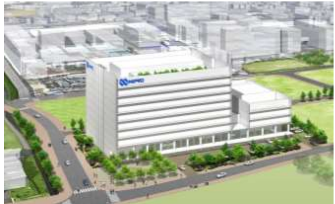
(鳥瞰パースイメージ)