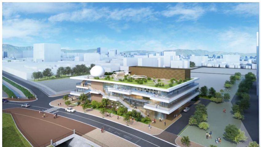
(鳥瞰パースイメージ)