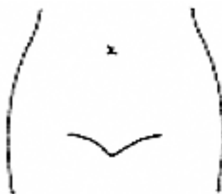
(ストマ及びびらんの部位等を図示)