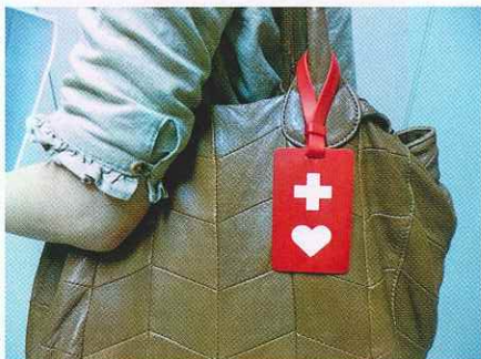
▲ 鞆等につけることができます。