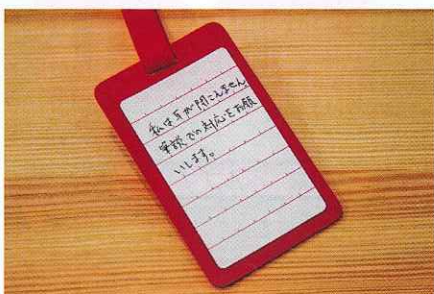
▲ 裏面にシールを貼り、必要な情報を記載することができます。