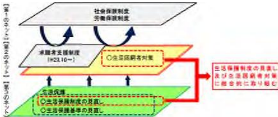
図表1 第2のセーフティネットの拡充のイメージ

法は、生活保護に至る前の段階の自立支援策の強化を図るため、必須事業として自立相談支援事業、住居確保給付金の支給を、任意事業として就労準備支援事業、一時生活支援事業、家計改善支援事業、子どもの学習・生活支援事業等を制度化している。事業の実施主体は、福祉事務所設置自治体であり、それぞれの事業を直接又は委託により実施する。