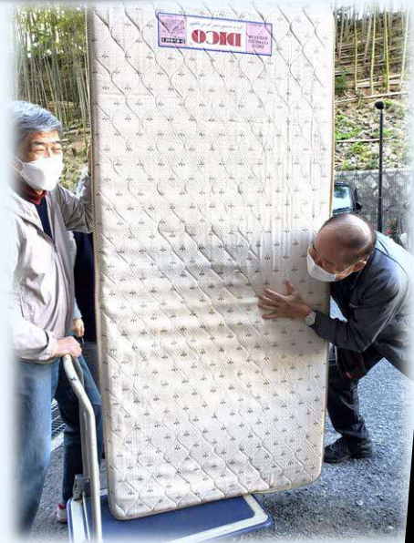
身近な地域の高齢者生活支援を 地域検討会で検討・交流会開催!