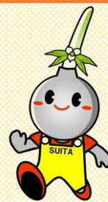
吹田市イメージキャラクター すいたん

これからもサービスや社会資源を充実させ、『認知症になっても安心して暮らせるまち吹田』をともに目指しましょう。