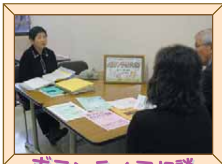
ボランティア相談

ボランティアをお願いしたい、活動したい…。そんなボランティア活動に関する相談を受けます。