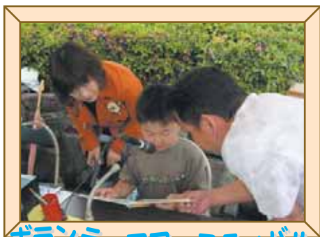
ボランティアフェスティバル

ボランティア体験コーナーや、パネル展示などボランティア活動の紹介や普及に努めています。