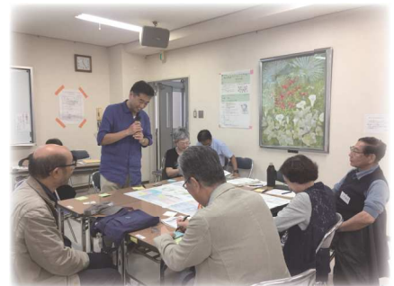
ワークショップ会場の様子