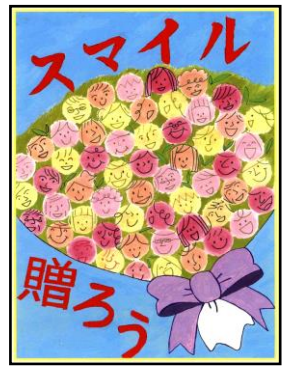
ねんど じんげん 2022年度 人権ポスター

※インターネット/スマートフォンからは、 青少年クリエイティブセンター で検索。