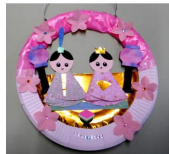
〜子どもクラブの作品〜 『おひなさま』

※インターネット/スマートフォンからは、 「青少年クリエイティブセンター」 で検索。