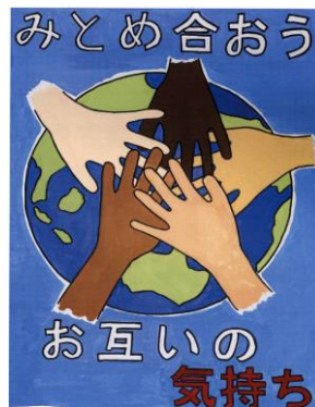
ねんど じんけん 2021年度 人権ポスター

※インターネット/スマートフォンからは、 青少年クリエイティブセンター で検索。