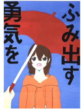
2021年度 人権ポスター

TEL 06-6389-2061 FAX 06-6389-2065 〒564-0002 吹田市岸部中1丁目16番1号 ※インターネット/スマートフォンからは、 「青少年クリエイティブセンター」 で検索。