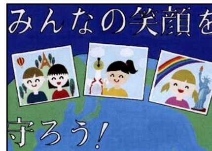
2021年度 人権ポスター

TEL 06-6389-2061 FAX 06-6389-2065 〒564-0002 吹田市岸部中1丁目16番1号 ※インターネット/スマートフォンからは、 青少年クリエイティブセンター で検索。