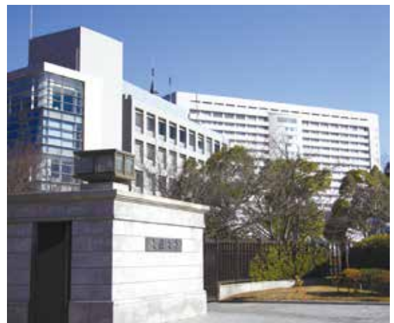
大阪大学の正門（山田丘）