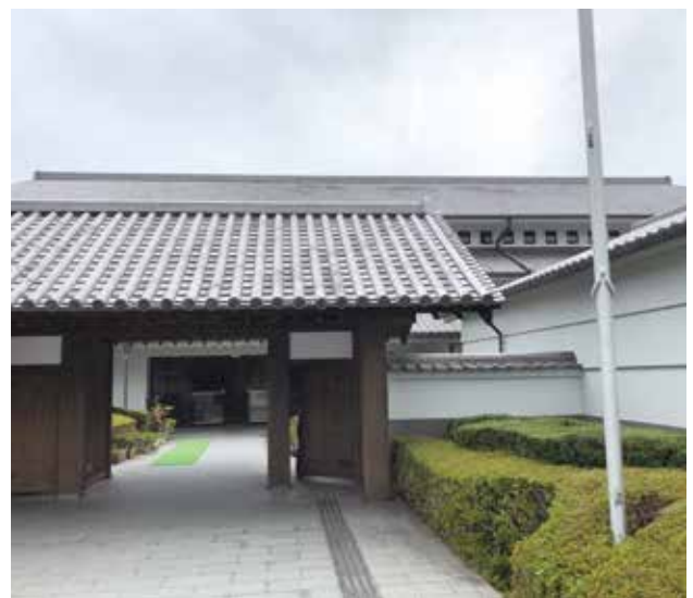
修繕予定の武道館