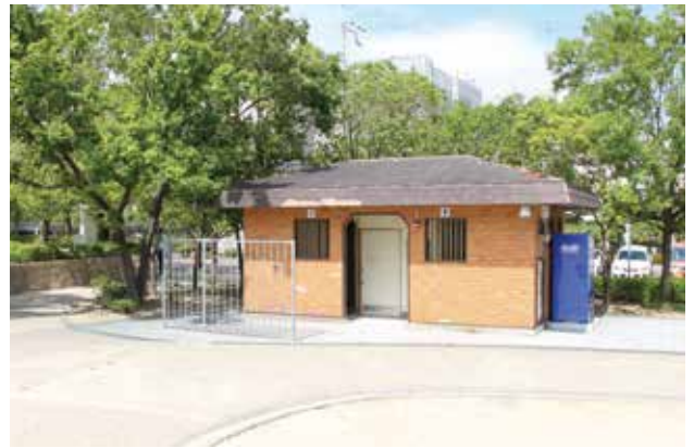
便器の洋式化や補修工事が実施される市内の公園トイレ (佐井寺南が丘公園)

○公園トイレの洋式化は、単純に和式を洋式化するだけでなく、出入り口幅の確保、手すりや網棚フックの設置といったユニバーサルデザイン、暖房、洗浄便座などの快適性に配慮し整備されたい。