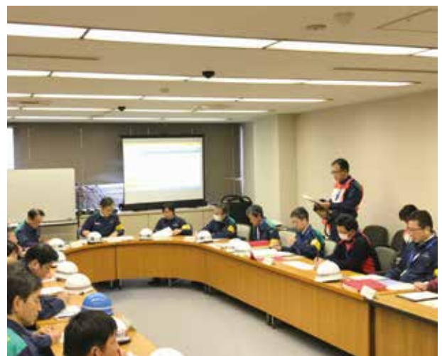
1月に実施した一斉合同防災訓練