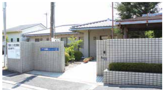
高齢者いこいの家