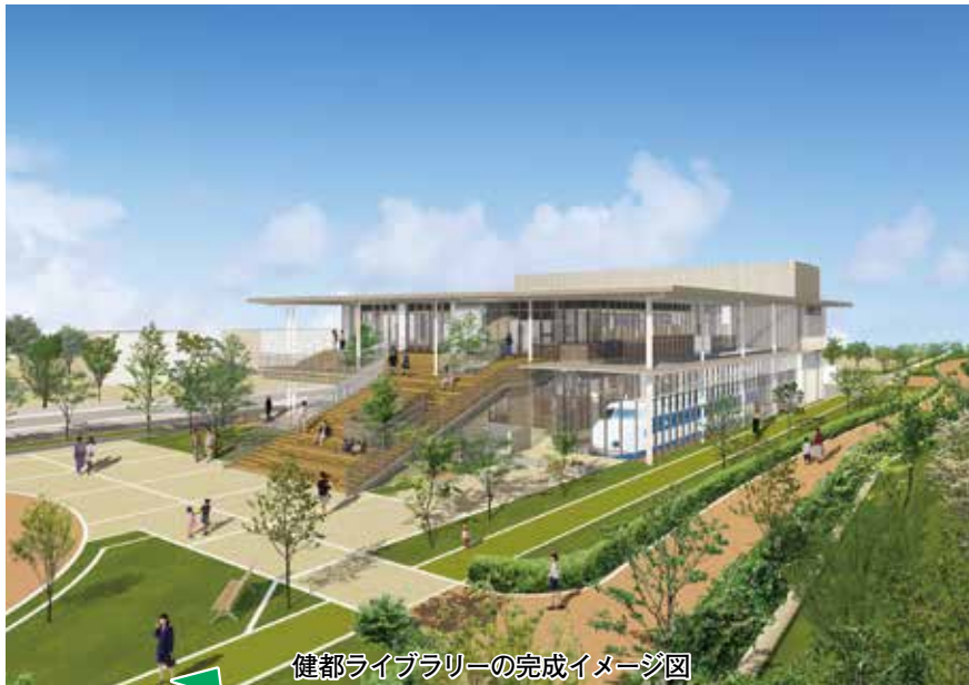
健都ライブラリーの完成イメージ図