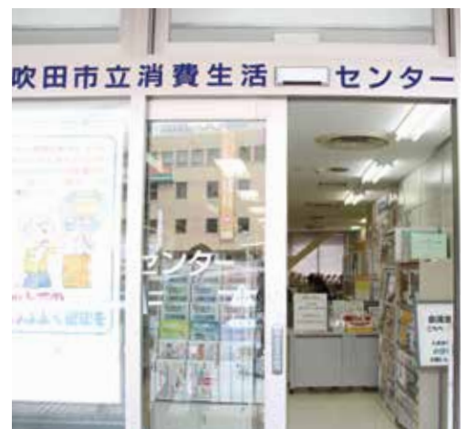
さんくす3番館にある消費生活センター