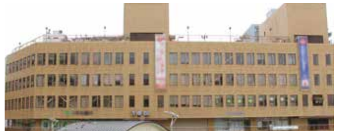
パスポートセンターが開設されるさんくす3番館

平成30年(2018年)11月から、さんくす3番館2階にパスポートセンターを開設し、平日の午前9時から午後5時30分まで、パスポートの申請受け付けや交付を行うための経費(ただし、申請受け付けは午後4時30分まで)