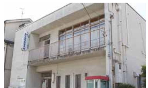
移転新築される南吹田地区公民館