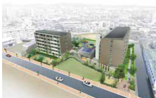
(仮称) 岸部中住宅の完成イメージ図