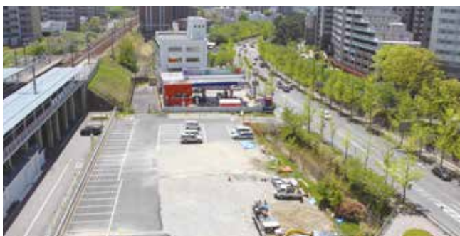
北部消防庁舎等複合施設の建設予定地(阪急南千里駅前)

第13駐車場跡地に消防・土木等の機能を備えた庁舎を建設するための基本構想・基本計画の策定及び基本設計に係る経費