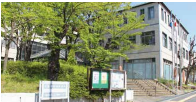
現在の吹田保健所(出口町)

平成32年(2020年)度の中核市移行に向けた検討に係る事務経費のほか、保健所を設置するため、大阪府への職員派遣研修を実施するための経費等