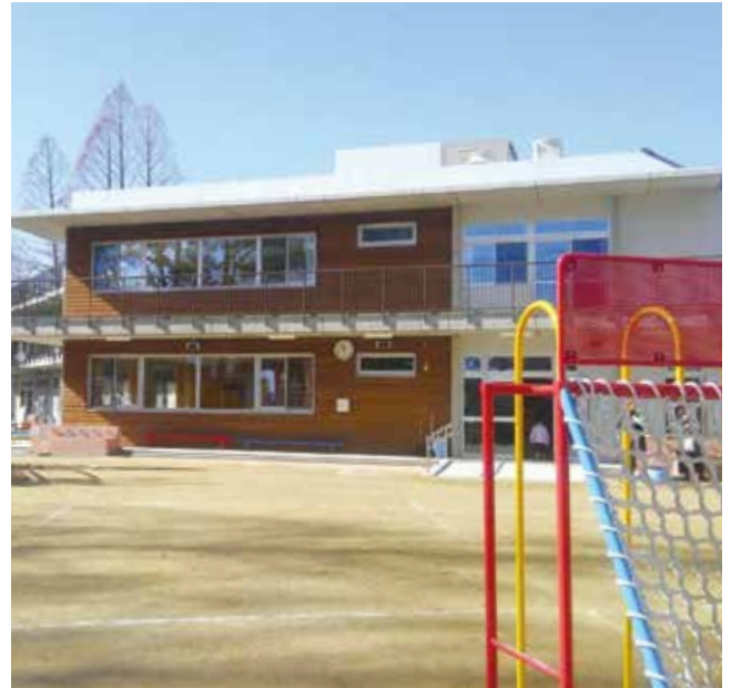
本年4月に開園した、はぎのきこども園(古江台2丁目)