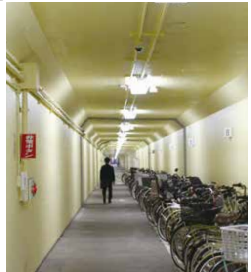
JR 岸辺駅前北自転車駐車場