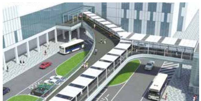
整備が進むJR岸辺駅北公共通路の完成イメージ図

北大阪健康医療都市(健都)において、健康、医療のまちづくりを進めるため、施設の整備を行い、北大阪の新たな都市拠点の創出を図るための経費