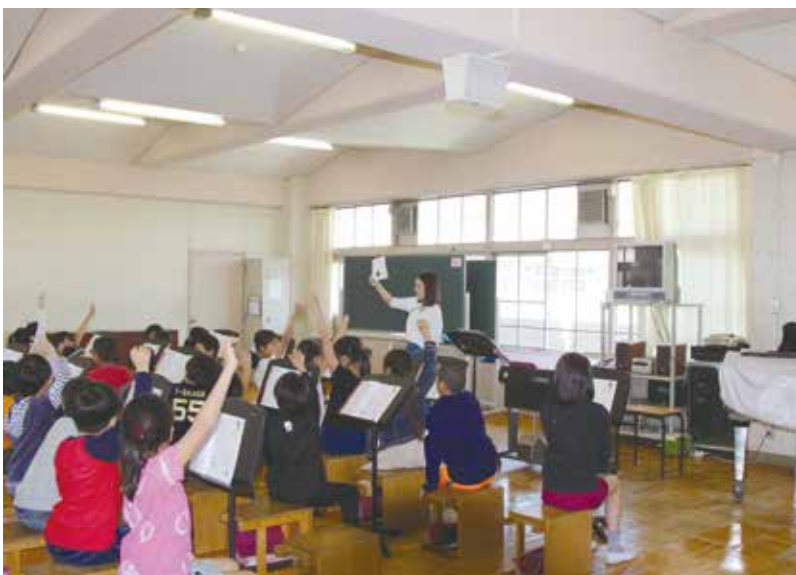
エアコンが設置される特別教室での授業の様子