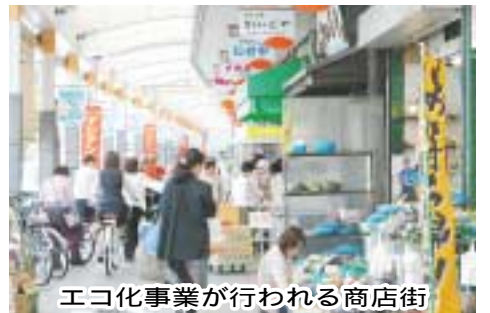
エコ化事業が行われる商店街

3年間の期間限定で学習支援員を派遣することの妥当性 教員数の確保など、教育現場の声を十分にしん酌したICT(情報通信技術)化及び教育設備の整備 図書館の毎日開館実施に伴う職員の適正配置 商店街エコ化事業について商店街の活性化及び住民にとってメリットとなる事業展開