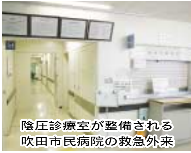
陰圧診療室が整備される吹田市民病院の救急外来

インフルエンザの流行期を目前にして陰圧診療室を整備する理由と完成予定 陰圧診療室整備による新型インフルエンザ対策の効果 外来入口における新型インフルエンザ患者への対策及び婦