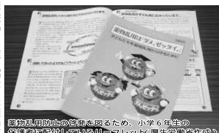
薬物乱用防止の啓発を図るため、小学6年生の保護者に配付しているリーフレット(厚生労働省作成)

はくくむ心の教育にも重点を置きながら、指導を徹底している。また、啓発活動として、校内への薬物乱用防止ポスターの掲示や、保護者への啓発リーフレットの配付等を行っている。今後とも子どもたちを薬物乱用から守り、薬物汚染がない社会の実現に向け、取り組んでいきたい。 問 違法薬物の撲滅には、自治体としても違法薬物の使用禁止を呼びかける広報啓発活動の強化や関係機関等との連携による相談体制の整備が必要ではないか。 答 市長 違法薬物対策については、各種関係団体と緊密な