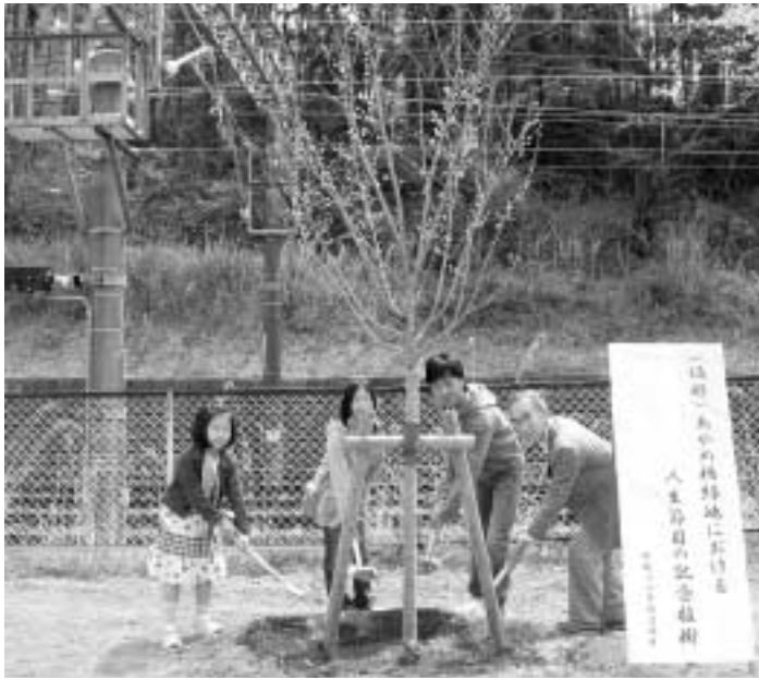
市民によるあやめ橋緑地(高野台)での記念植樹

問 環境負荷の低減を実践するため、植樹に協力した人への市民税減額や、樹木管理における高齢者の人材活用など、温室効果ガスの吸収源に協力を促す公共投資を行うてはどうか。 答 環境政策推進監 環境対策を新たな雇用創出や産業育成に結び付けるための地域からの取り組みとして、自然エネルギーの普及・促進やグリーン購入による環境関連産業の育成、環