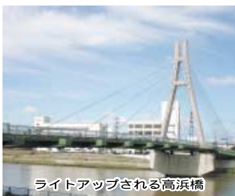
ライトアップされる高浜橋