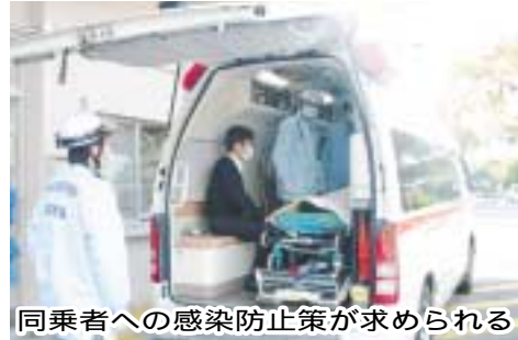
同乗者への感染防止策が求められる

地域活性化・経済危機対策臨時交付金等が交付されなかった場合の影響と対応 緊急雇用創出基金事業として本市が実施する被雇用者の募集及び選考方法 基幹システム移行による情