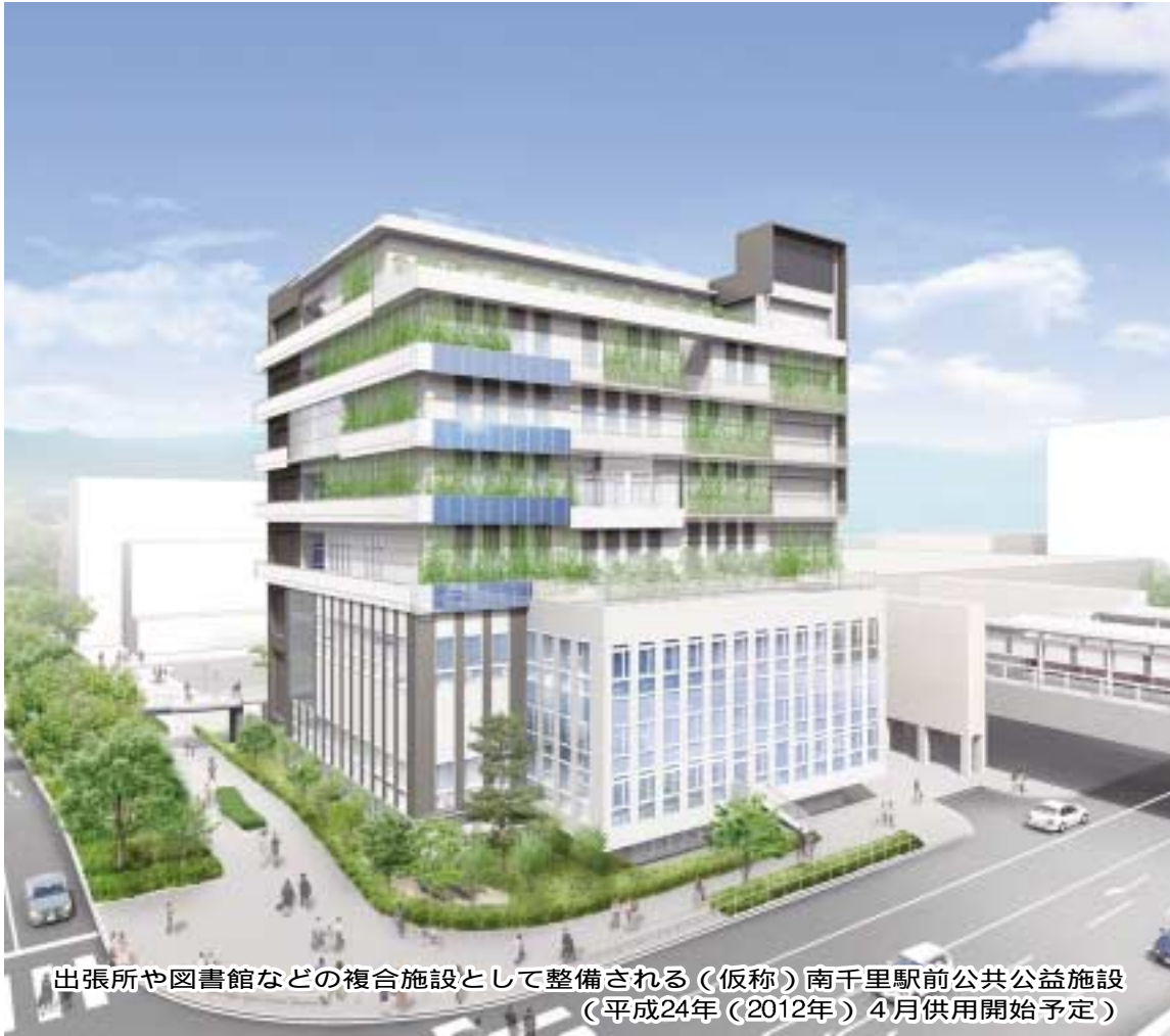
出張所や図書館などの複合施設として整備される(仮称)南千里駅前公共公益施設 (平成24年(2012年)4月供用開始予定)

吹田市泉町1丁目3番40号 吹田市議会事務局 代表電話 06 6384 1231 直通電話 06 6384 2696