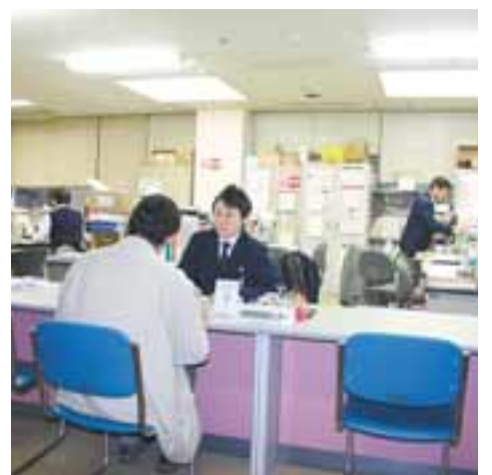
地域包括支援センターの窓口