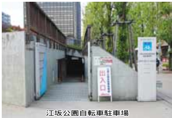
江坂公園自転車駐車場