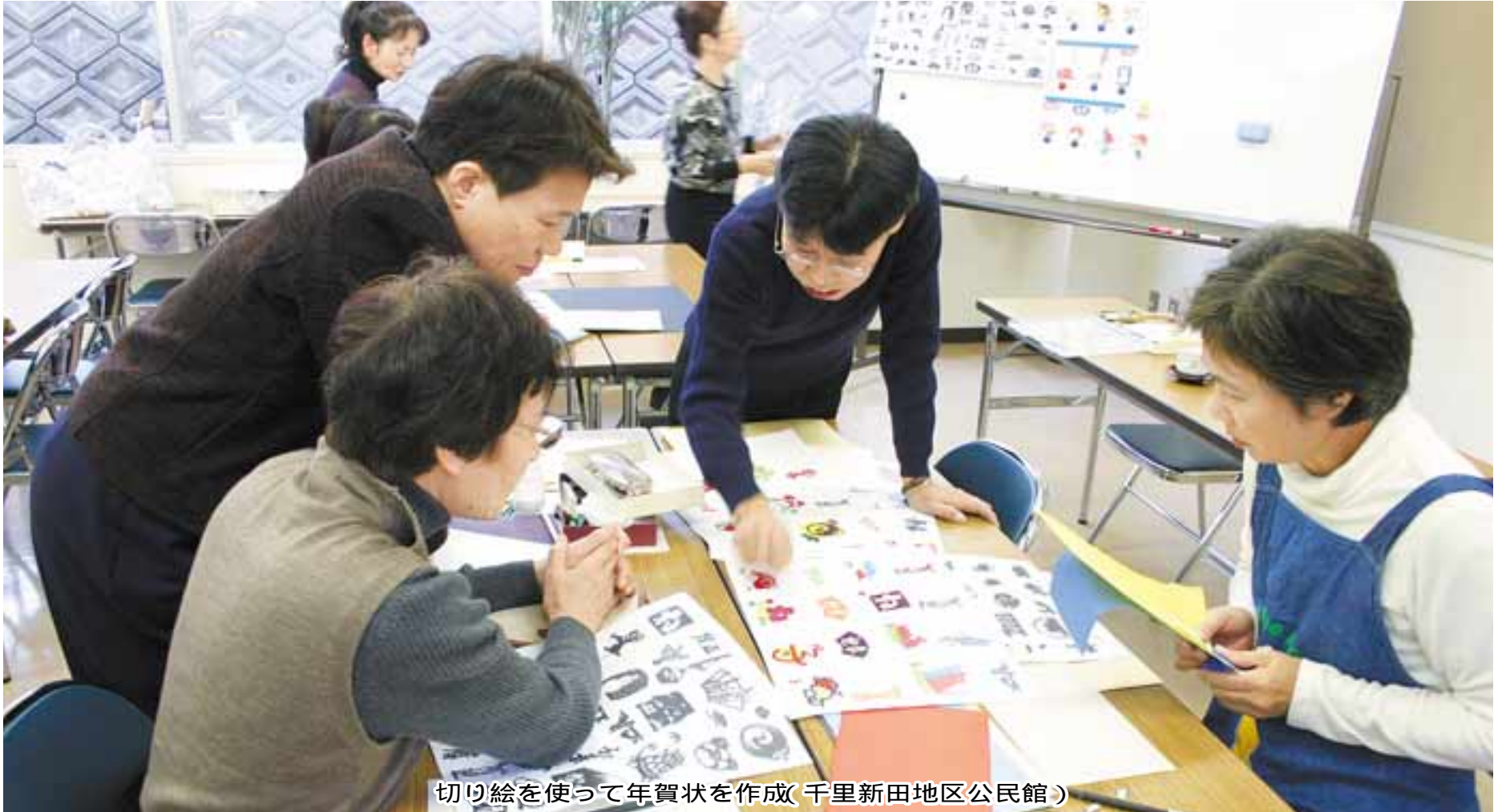
切り絵を使って年賀状を作成(千里新田地区公民館)

編集者 六島 久子 西川 巖穂・竹内 忍一 島 晃・柿原 真生 発行所 吹田市泉町1丁目3番40号 吹田市議会事務局 代表電話 06-6384-1231 直通電話 06-6384-2696