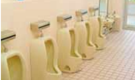
整備を終えた幼稚園のトイレ

答 学校教育部 小・中学校の老朽化したトイレは、年次的に整備を進めており、平成16年(2004年)度までに、各学校のトイレのうち男女1か所ずつ