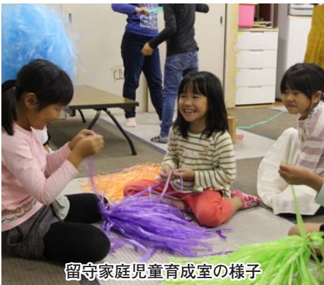
留守家庭児童育成室の様子