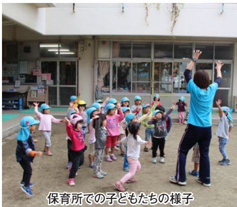
保育所での子どもたちの様子

△反対意見の概要▽ 児童保育の民間委託推進は破綻しており、指導員の処遇改善や業務体制の改善に専念すべきである。