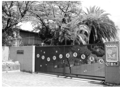
幼稚園型認定こども園に移行する佐竹台幼稚園

○佐竹台幼稚園を含む公立幼稚園8園を認定こども園として整備することを決定した経過