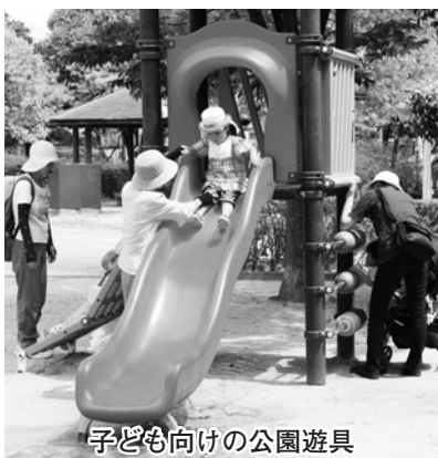
子ども向けの公園遊具