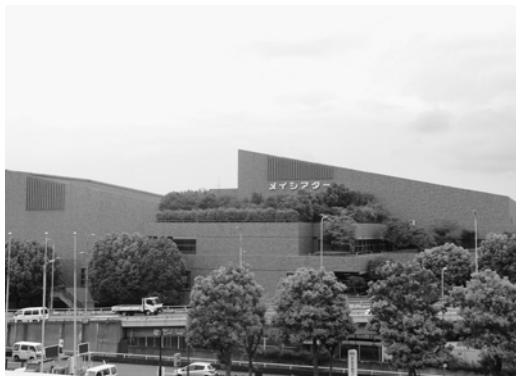
大規模改修される文化会館