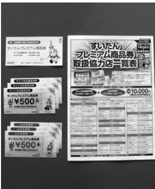
第1回プレミアム商品券

答まち産 次回の販売方法については、予算の範囲内で不公平感のない、より購入しやすい方法を検討したい。