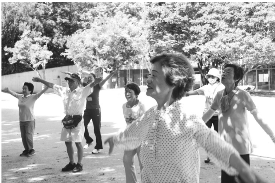
介護予防のため、地域の身近な場所で実施している公園体操（江坂公園内）

から今後4年間の市政運営の基本となる施政方針が示され、各会派の議員が施政方針を中心に市政全般について質問を行いました。