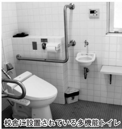
校舎に設置されている多機能トイレ

上経過した校舎や体育館の改修を9年間で、またトイレの改修を5年間で実施する。多機能トイレについては、校舎部分には設置済みであるが、体育館にも改修に併せて設置する。