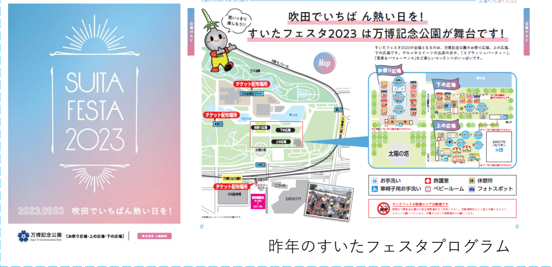
昨年のすいたフェスタプログラム

総ページ：40～48ページ 発行日：8月上旬 ※都合により変更になる場合がございます 版 型：B5サイズ 発行部数：35,000部 配布方法：8月上旬より公共施設等市内全域に配布