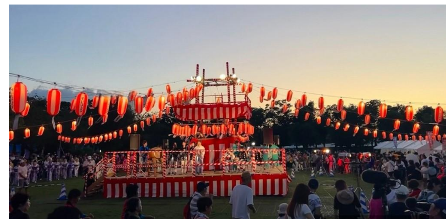
すいたフェスタ2023の様子

主催：すいたフェスタ実行委員会 〒564-8550 吹田市泉町1-3-40（吹田市役所 シティプロモーション推進室内）