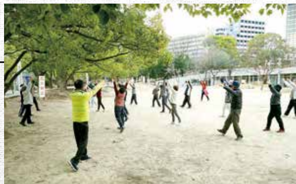
運動習慣を身につけようと多くの人たちが集まり行われた「ひろばde体操」(江坂公園にて)