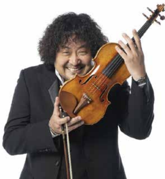
「Home Suita Home」 ミュージックビデオ

市民の皆さんに「Home Suita Home」に親しんでいただけるよう、ホームページでショートバージョンの音源を無料でダウンロードできるよう配信したほか、ミュージックビデオの制作・公開、市の公共施設やイベントでの放送等を行いました。さらに、市内学校の吹奏楽部の学生や市内で活動する楽団等にも、演奏を通じて楽曲に親しみ、市民に広めていただけるよう、吹奏楽や弦楽用の編曲譜も制作しました。また、「Home Suita Home」は、令和2年9月に発売された葉加瀬さんのアルバム「FRONTIERS」にも収録されました。