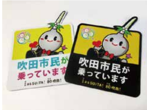
【マグネットシート】