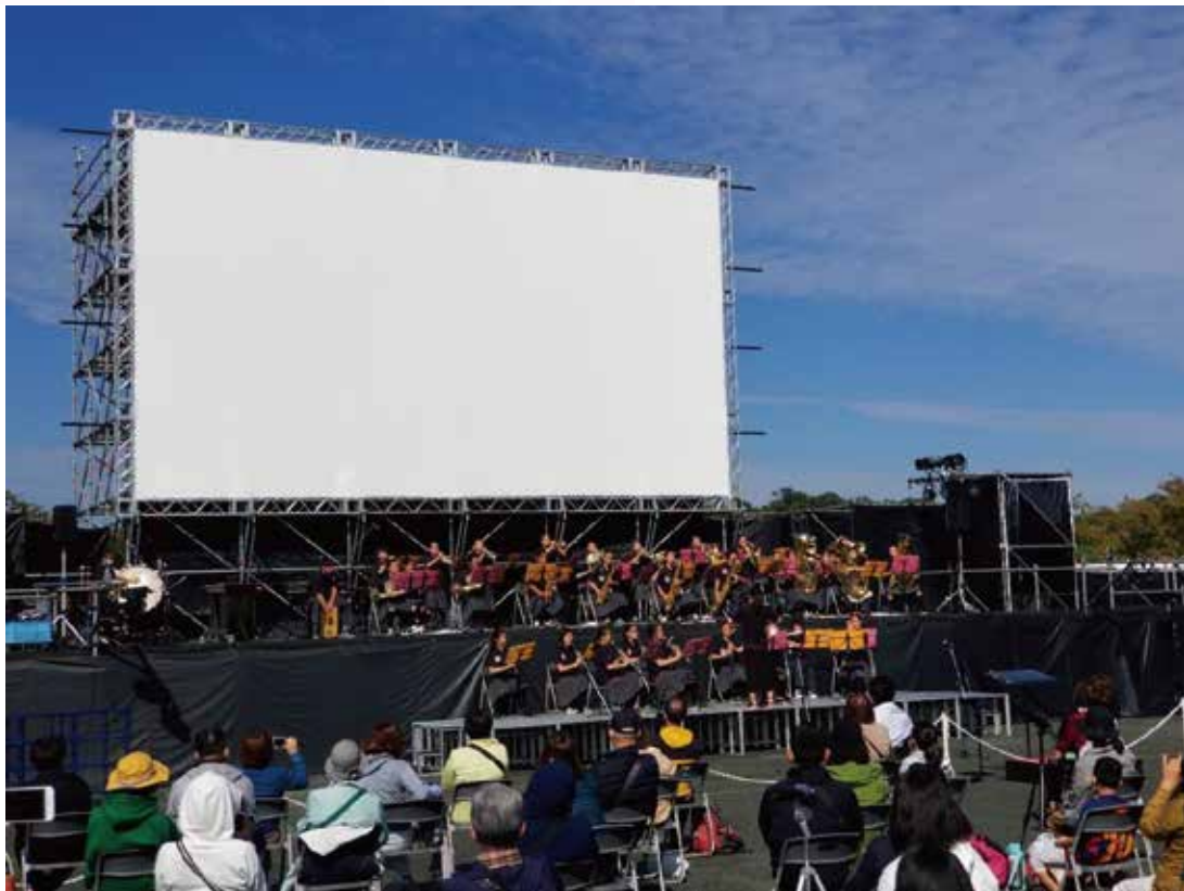
主催：吹田市制施行80周年プロジェクト会議 共催：吹田市 協力：関西大学応援団吹奏楽部 協賛：大幸薬品株式会社