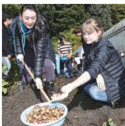
学生による吹田くわいの 収穫ボランティア

市内にある5大学1研究機関(関西大学、大阪大学、大阪 学院大学、千里金蘭大学、大和大学、国立民族学博物館)と市が 連携協定を結び、共同研究や学生のボランティア活動 などについて協力。大学が多い吹田市なら では取り組みです。