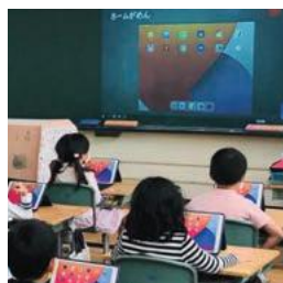
市立小中学校でタブレット・ PCを1人1台導入

デジタル前提の社会で生きる子供たちがICTを 活用する際に必要な「共感力を働かせ、自他の幸せ のために立ち止まって考え、行動できる力」を身に付 けられるように、吹田市は自治体として初めてデジタ ル・シティズンシップ教育に取り組んでいます。