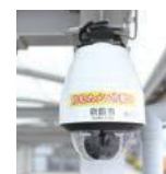
562台の街頭 防犯カメラを設置

青色防犯パトロール隊や犬の散歩をしな がら見守り活動を行うわんわんパトロール隊 などの団体が、地域の安全を見守っています。 また街頭防犯カメラの設置やドライレ コーダー搭載車を所有している人への見守 り協力の呼びかけなど、地域の見守りの目 を増やしています。