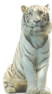
ホワイトタイガー