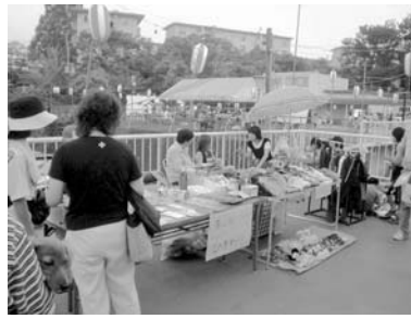
地域の人々と一体的に取り組む夜店(青山台近隣センター)

吹田市内においても多くの商店街が活性化策に取り組まれています。今号では主に千里ニュータウンの事例を取り上げながらまとめました。