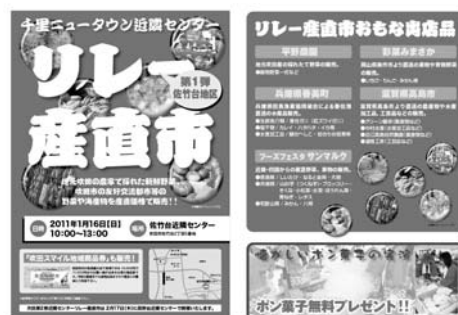
近隣センターで行われている「リレー産直市」

これからの集客力アップの方策として、「日常性の魅力商品」を活用するという方法が考えられます。