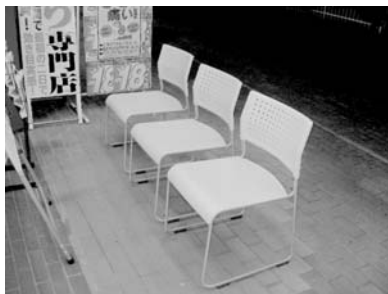
高齢者にやさしい椅子(津雲台近隣センター)

高齢化の進む状況にあっては、配達以外にも商店街としてどう対応すべきかが論議されている。さまざまなサービス対策が考えられています。千里ニュー