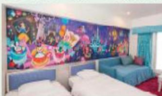
「ウィッシュ」スタンダードルーム (一例)

パークの夢や冒険をそのままに手軽なリゾートステイを楽しめるホテル。新浦安エリアに位置し、シンプルなサービススタイルで手軽にリゾートステイをお楽しみいただけます。冒険や発見がテーマの「東京ディズニーセレブレーションホテル:ディスカバー」と、夢やファンタジーがテーマの「東京ディズニーセレブレーションホテル:ウィッシュ」の2棟からなります。