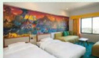
「ディスカバー」スタンダードルーム (一例)