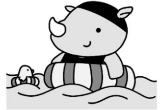
福祉共済キャラクター キョウサイくん (サマーバージョン)

編集発行 吹田市都市魅力部 地域経済振興室 〒564-8550 吹田市泉町 1-3-40 TEL(06)6384-1365(直通) FAX(06)6384-1292 メール:k_kyosai@city.suita.osaka.jp