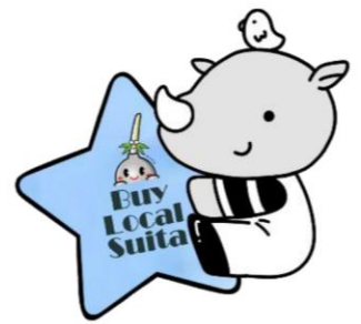
福祉共済キャラクター キョウサイくん (バイローカルバージョン)

編集発行 吹田市都市魅力部 地域経済振興室 〒564-8550 吹田市泉町 1-3-40 TEL(06)6384-1365(直通) FAX(06)6384-1292 k.kyosai@city.suita.osaka.jp