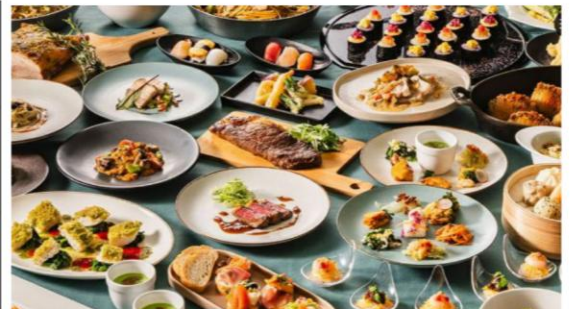
※写真はイメージとなります。