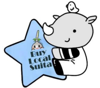
福祉共済キャラクター キョウサイくん (パイローカルバージョン)