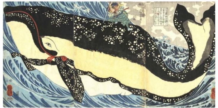
「宮本武蔵と巨鯨」弘化4年(1847)頃 個人蔵

本展では、「相馬の古内裏」「みかけ八こ八みがとんだいゝ人だ」「其まゝ地口猫飼好五十三疋」などの超有名作品はもちろん、その類稀なる才能が遺憾なく発揮された作品群、約200点を6つのジャンルに分け、国芳の多彩な活躍ぶりを分かりやすくご紹介します。